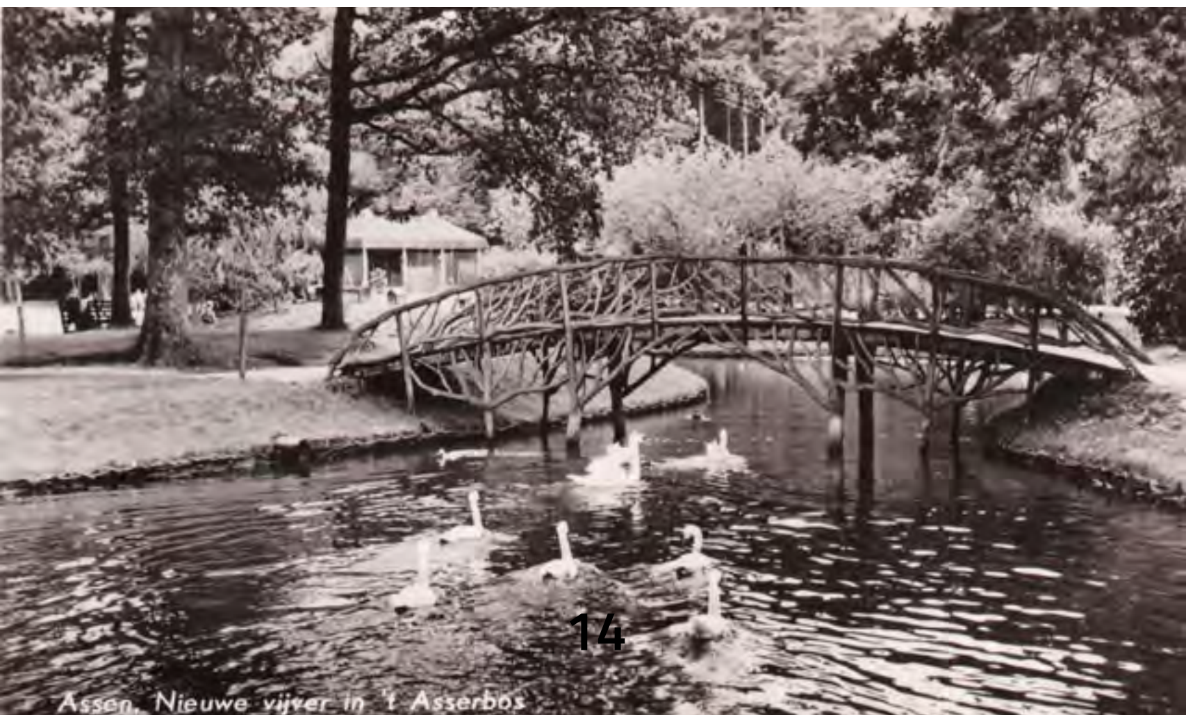
Foto nieuwe vijver jaren '50

In de negentiende eeuw heeft het gemeentebestuur van Assen het een en ander gedaan om het Asserbos aantrekkelijk te maken voor de bevolking. Zo liet de gemeente in 1836 de