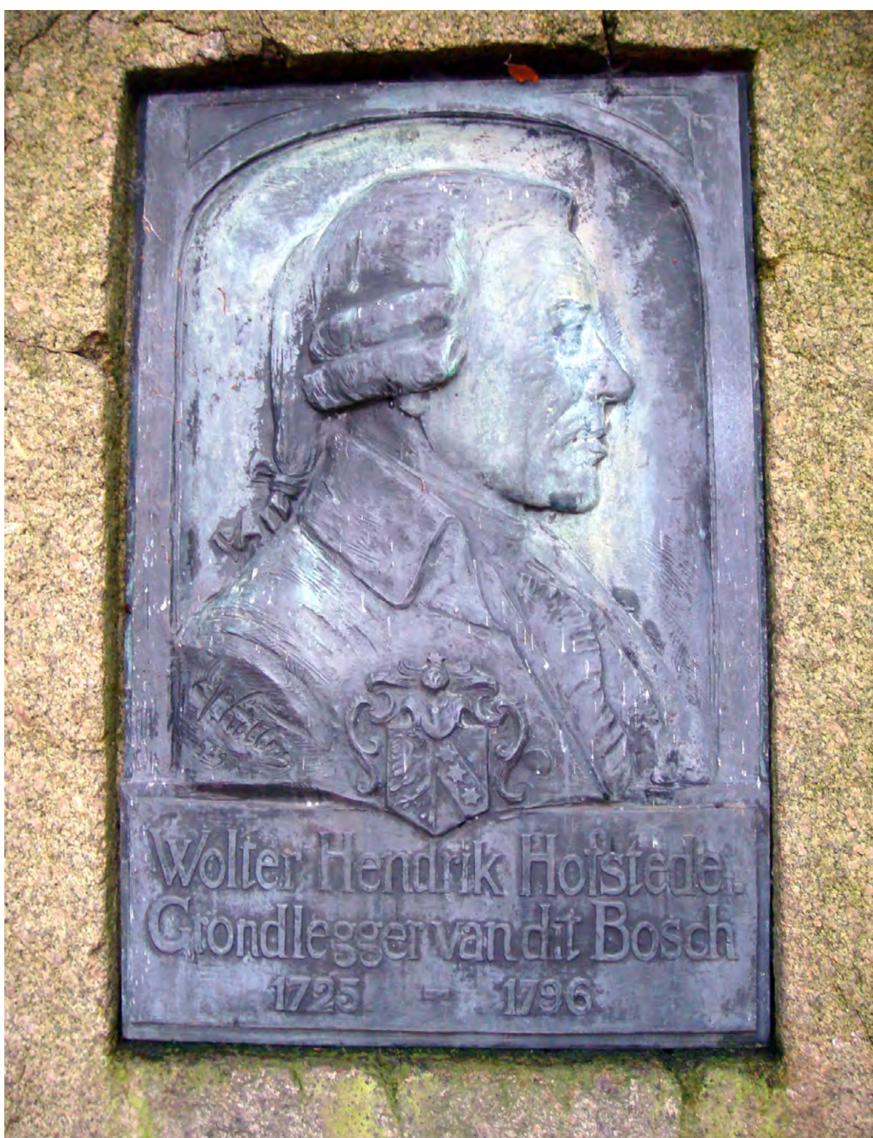
Plaquette W.H.Hofstede

Na de reformatie werd het Asserbos eigendom van de Landschap Drenthe. Na mislukte ontginning ten westen van de Bosbeek besloot het landschapsbestuur het gebied weer met bos in te planten.