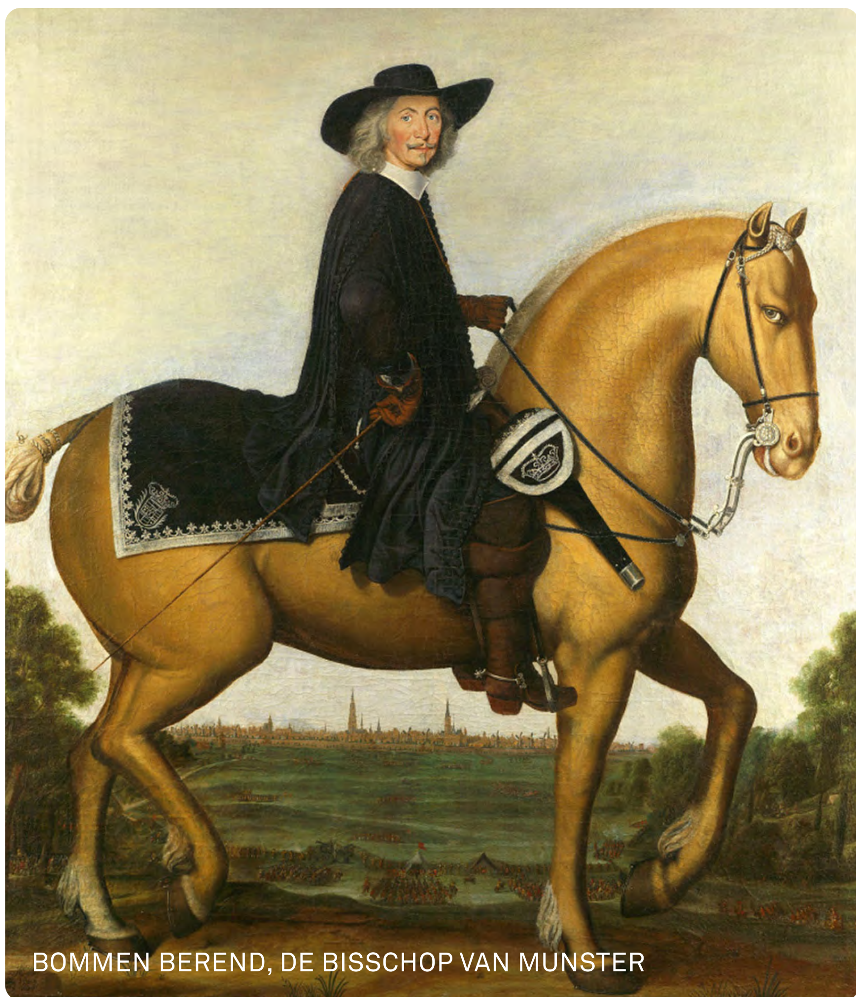
BOMMEN BEREND, DE BISSCHOP VAN MUNSTER

de Valtherschans maar de dreiging van de vesting heeft wel invloed gehad op de militaire strategie rondom het beleg van Groningen. In 1848 was de schans al lange tijd niet meer in gebruik, langzaam is deze uiteengevallen in het landschap en verdwenen. Mede door het initiatief van Plaatselijk Belang Valthe is een gedeeltelijk herstel van de schans gerealiseerd in 2022 en er wordt nog hard gewerkt aan het op de kaart zetten van deze toch bijzondere status van dit oude verdedigingswerk.